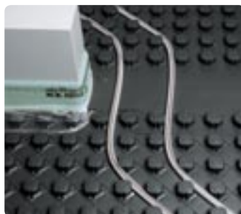
Deurovergang met uitvlakelement

Uponor Tecto is afgestemd op de veelvuldig geteste Uponor Velta PE-Xa leiding volgens procédé Engel. De afmetingen 14 en 16 mm zijn zuurstof-diffusiedicht volgens DIN 4726. Dankzij de zeer grote flexibiliteit is een snelle en arbeidsvriendelijke montage zelfs bij de kleinste buigradius binnen de normen gewaarborgd.