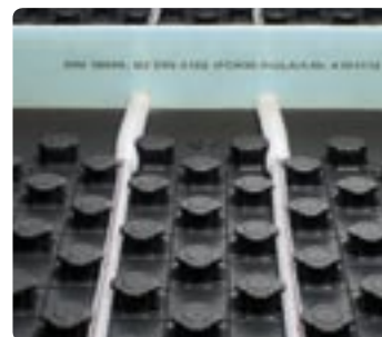
Leidinginstallatie met dilatatieprofiel

Overgangen tussen ruimten zijn snel gemaakt. Aangezien het uitvlakelement in het vlakke gedeelte geen noppen heeft, leidt dit automatisch tot een goed verloop van de flexibele verwarmingsleiding. Moeilijke deurovergangen behoren daarom tot het verleden.