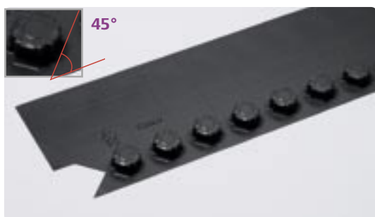
Het Uponor Tecto uitvlakelement 45° versie

De moeilijke deurovergangen worden met de Uponor Tecto uitvlakelementen kinderspel – één enkele noppenrij zorgt voor de veilige verbinding met het aangrenzende element. Aansluitleidingen in het deurbereik kunnen zonder storende noppen worden aangebracht. En dat bij twee varianten 45° en 90° uitvoering.