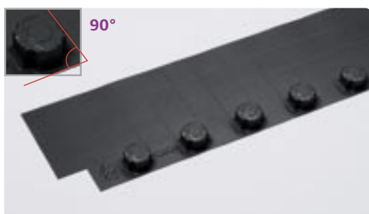
Het Uponor Tecto uitvlakelement 90° versie