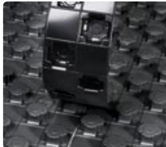
De koppelstrook wordt ingezet

De clou van de Tecto elementen zijn de noppen. De afdekfolie waarborgt enerzijds een schone en eenvoudige montage door de maxi-mini-noppen en verschaft anderzijds optimale dichtheid door de overlapping.