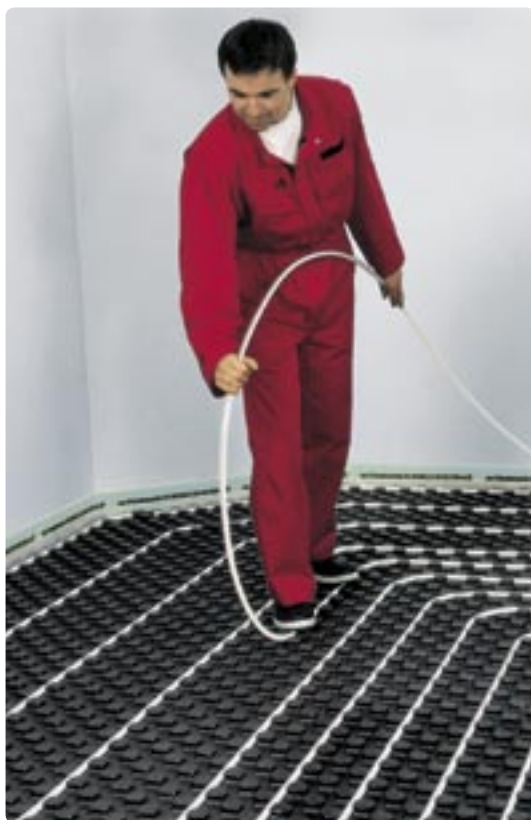
De Uponor Tecto elementen kunnen heel eenvoudig alleen worden gemonteerd. Net als de flexibele Uponor Wirsbo PE-Xa leidingen: met de voet erin drukken - klaar