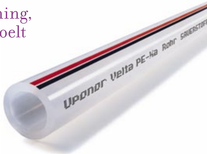
Uponor Velta PE-Xa leiding volgens procédé Engel in de afmetingen 14 x 2 mm en 16 x 2 mm: licht, buigzaam, veilig en snel gemonteerd.

Bovendien is Uponor Tecto zeer belastbaar: in de nominale dikte 30-2 mm met verbazingwekkende 500 kg/m 2 , in 11 mm met 3,0 t/m 2 .