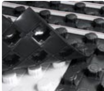
Overlappende Uponor Tecto 2 elementen

De clou van de Tecto elementen zijn de noppen. De afdekfolie waarborgt enerzijds een schone en eenvoudige montage door de maxi-mini-noppen en verschaft anderzijds optimale dichtheid door de overlapping.