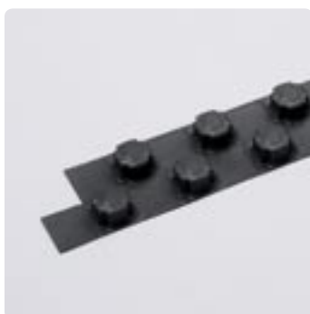
De Uponor Tecto koppelstroken