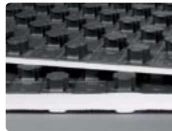
Uponor Tecto noppenplaat in de nominale dikte ND 11 dan wel ND 30-2