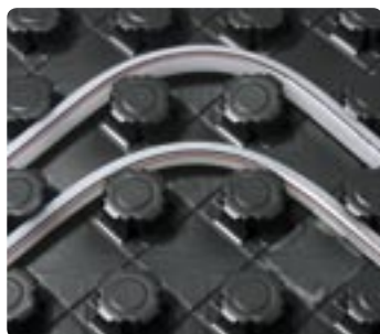
Het Uponor Tecto 2 element maakt een kleine buigradius mogelijk

Het Uponor Tecto uitvlakelement niet alleen voor de deurovergang een snelle oplossing. Het is ook ideaal voor dilatatievoegen op zeer grote oppervlakken of bij de wandaansluiting zoals hier in de 90° versie. De folie van de randisolatiestrook ligt tussen het isolatie-element en de afdekfolie – met name aan te bevelen voor gietvloeren.