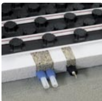
Voorbeeld voor de vloeropbouw met de noppenplaat ND 11