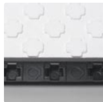
Het speciale profiel aan de onderzijde van de plaat en de dubbele schuiming van de geïntegreerde warmte-isolatie reduceren het contactgeluid in combinatie met het Uponor Tecto element ND 30-2. Optimaal in woonobjecten