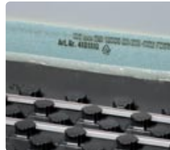
Uitvlakelement bij wandaansluiting

Met de koppelstrook wordt de montage van Uponor Tecto nog flexibeler. Zo worden reststukken overeenkomstig de bestratingmethode tijd- en snijafvalbesparend zonder zelfoverlapping aangebracht, eenvoudig op de maxi-noppen drukken.