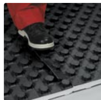
Installeren en verbinden worden zonder hulp nauwkeurig afgehandeld: de elementen eenvoudig met de voet op de folieoverlapping samenvoegen – klaar. Dat spaart tijd en kosten

De nominale plaatdikte van 11 mm is bijzonder geschikt voor industriële toepassingen. Zij dragen een belasting van max. 3,0 t/m 2 . De leidingen van de drinkwater- en elektrische installatie zijn met twee lagen in de constructieopbouw veilig. Zij bevinden zich in de onderste laag. Ongeacht dilatatievoeg of wandaan-sluiting; u maakt gebruik van een uitvlakelement voor ND 11 en ND30-2. Overigens, afdekfolie en isolatie zijn afzonderlijk verpakt voor meer flexibiliteit bij het installeren.