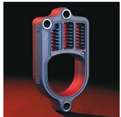
Die Eutectoplex-Heizfläche garantiert Langlebigkeit und eine hohe Betriebssicherheit.

Die Regelung Vitotronic 200 mit Klartextanzeige und grafischer Unterstützung ermöglicht dem Nutzer eine einfache, selbst erklärende und menügeführte Bedienung. Über die Vitotronic lassen sich Heizungsanlagen mit einem ungemischten und bis zu zwei gemischten Heizkreisen komfortabel regeln.