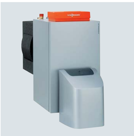
Vitorondens 200-T im Leistungsbereich von 67,6 bis 107,3 kW