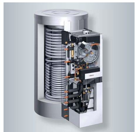
Vitosolar 300-F mit Öl-Brennwert-Heizgerät Vitoladens 300-W

Bereits ab Werk ist Vitosolar 300-F mit Heizkreisverteilung, Solarkreis Komponenten, wärmegeprägten Rohrleitungen und Absperrventilen vormontiert. Die Anschlüsse zur Einbindung eines zweiten Wärmeerzeugers, etwa eines Holzheizkessels, sind bereits vorgesehen. Alle Anschlüsse lassen sich abhängig von den Platzverhältnissen rechts oder links aus dem Gerät herausführen.