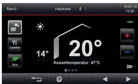
Regelung Vitotronic 200 mit Farb-Touch-Display (in Verbindung mit Gas-Brennwert-Wandgerät Vitodens 300-W)