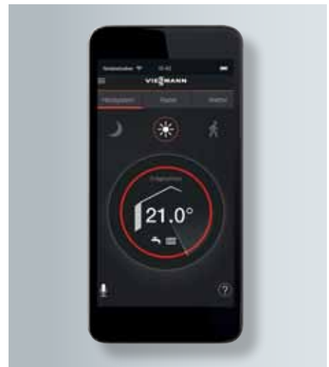
Vitotrol Plus App

Bereits ab Werk verfügt Vitodens 300-W über eine integrierte Internetschnittstelle. Per Vitotrol Plus App lässt es sich vom Smartphone oder Tablet von überall regeln. Heizgerät und DSL-Router können über ein Ethernet-Kabel direkt miteinander verbunden werden.